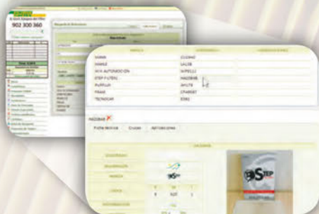
Búsqueda en el catálogo por modelo

Esta web constituye una potente herramienta para la gestión diaria de los negocios de los clientes de Filtros Cartés.