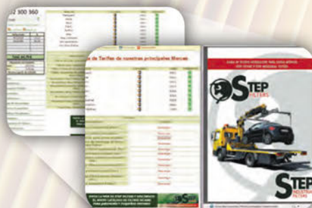
Zona de descarga