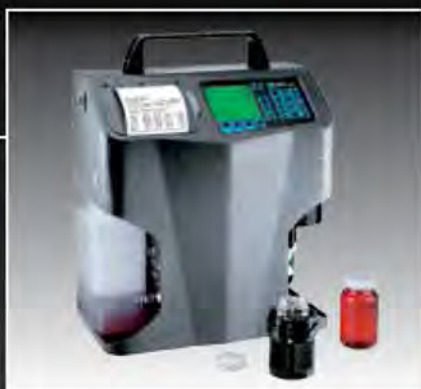
CONTADOR DE PARTÍCULAS LÁSER

Determinación del grado de contaminación del aceite y sus posibles causas.