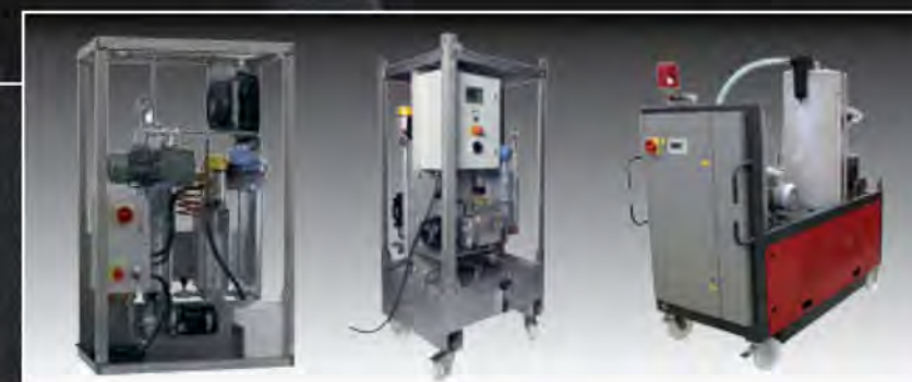
PURIFICADORES DE ACEITE MINI, MAXI Y CON CONTADOR DIGITAL DE PARTÍCULAS INTEGRADO

Deshidratación, filtración, des-aireación y purificación del aceite, manteniendo sus características y propiedades lubricantes muy cercanas a las originalmente especificadas (ISO 4406).