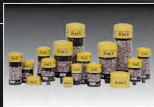
ACONDICIONADORES DE AIRE CON Z-R GEL

Filtración de las partículas sólidas y agua en la admisión de aire de los depósitos.