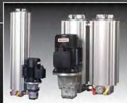
FILTROS PARA INSTALACIONES OFF-LINE (circuito riñón)

Filtración off-line para la eliminación de partículas sólidas y agua, de depósitos de hasta 11.000 litros de capacidad, con configuraciones individuales o de varias carcasas, en función de las necesidades del sistema.