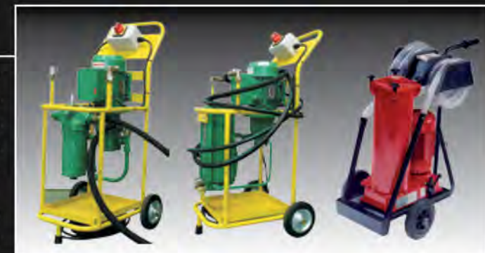
UMFC2, UMFC3 (microfiltrado) y UMFC5_CP (con contador de partículas integrado)

Realización de una primera limpieza y posteriores mantenimientos, reduciendo el nivel de contaminación sólida provocado por el desgaste, avería o parada de máquinas, hasta poner el aceite en clase.