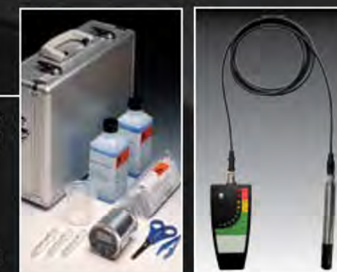
WATER TEST KIT Y SONDA DE HUMEDAD

Determinación cuantitativa del grado de saturación de agua presente en el aceite.