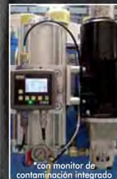
*con monitor de contaminación integrado