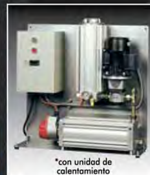
*con unidad de calentamiento