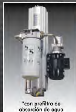
*con prefiltro de absorción de agua